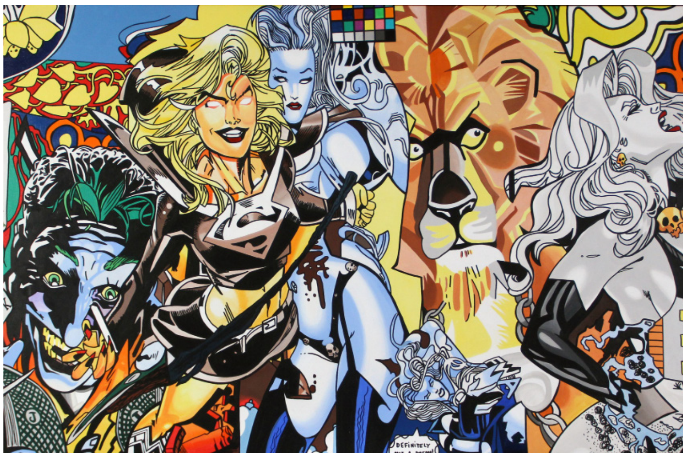
Le lion , 114x195cm, 2018

Le centre présentera 21 toiles, 11 collages originaux, des lithographies ainsi que des digigraphies contemporaines allant de 2020 à 2023. Ces œuvres créent une réinterprétation du flux d'images qui nous entoure pour en faire une narration qui témoigne de l'histoire du 20 et 21 ème siècles. Son œil est critique et satirique mais jamais dénué d'humour, avec un travail haut en couleur accessible à tous.