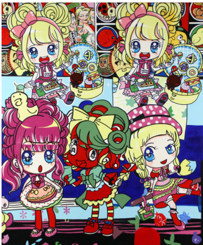
The birthday party, 185x154 cm, 2025

Certaines toiles présentent différents « scapes » qui sont des compositions monothématiques, faites d'accumulations organisées en paysages panoramiques. Mais aussi des compositions plus légères qui font se côtoyer des œuvres de Picasso, des portraits de Raphaël avec des super-héros. L'imagerie pop américaine avec les comics Marvel, Mickey Mouse se transforme avec le temps en figures kawai des mangas japonais. Ces œuvres travaillent toujours avec les imageries qui nous entourent, jamais figées et toujours en mouvement à travers les époques.