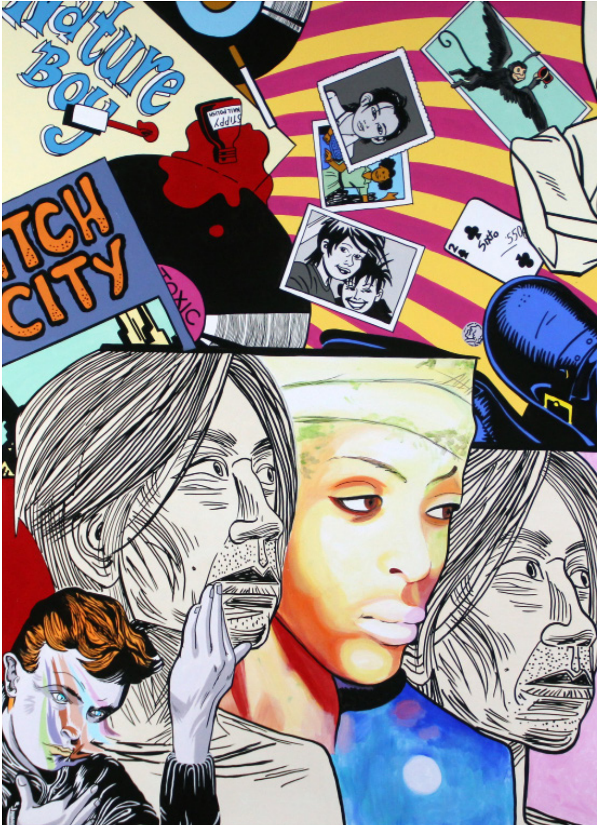
Tic City, 114x195cm, 2018

« Je suis né à l'ouest de l'Islande, tout près du glacier où Jules Verne commence son voyage au centre de la Terre! Dans une des mille petites îles au cœur d'un fjord énorme où la marée est parfois de 12 mètres... Nous sommes très curieux, nous, Islandais. Nous parlons la même langue qu'au IXe siècle. Le Vieux Norrois, le Latin scandinave. Ma curiosité, mon envie de bouger, de ne pas rester sur place viennent peut-être de là ».