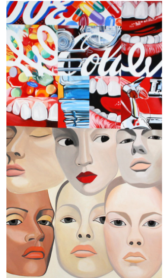
6 faces olle, 181x102 cm, 2021

Exemple : Dans l'exposition, nous présenterons l'œuvre 6 faces Ole , provenant de la série des « méca-make-up » où il associe des visages de mannequins découpés dans la presse avec des éléments mécaniques, comme des gents de voitures, et des éléments de la consommation de masse.