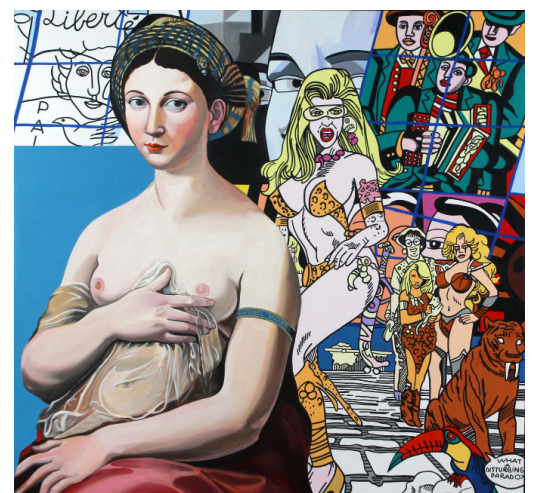
Sans titre, 150x160 cm , 2020

ARTS : Utilisation de reproductions de tableaux de la même manière que la publicité. Les œuvres sont reproduites et traitent comme de simples images et associées à différents objets. Juxtaposés parfois à des éléments de consommation.