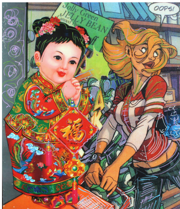
Oops, 102x89 cm, digigraphie sur toile, 2023

« La peinture doit être de son temps et refléter son époque »