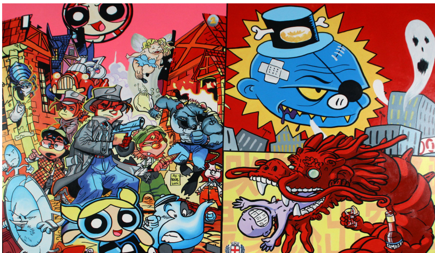
Red dragon, 184x124 cm, 2025

Ses compositions peuvent être comparées au ALL OVER de Jackson Pollock, où l'espace de la toile est complètement saturé, rempli jusqu'aux bords avec des compositions fortes en couleurs et en graphisme qui en font parfois des œuvres dures au regard. Le spectateur doit y trouver une porte d'entrée ( un élément reconnaissable ) pour ensuite en faire une lecture. Les couleurs vives et fortes renforcent le sentiment de saturation. Au premier regard, on pourrait même penser qu'il n'y a aucune logique, mais les œuvres sont extrêmement structurées et c'est justement sur ce point que la peinture d' ERRÓ est contemporaine.