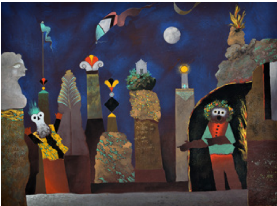
Vous ne craignez rien , peinture flashe sur papier arches, 74x55 cm, 2020