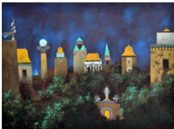
Nocturne, peinture flashe sur papier arches, 73x55 cm, 2021

Jeune, Roger Blaquière était un habitué du Musée Guimet à Paris, il y découvrait d'autres mondes et modes de représentation différents de ceux de l'art occidental. Un imaginaire se construira de ces souvenirs, illustrations fantasmées d'un rêve orientaliste très personnel et théâtral.