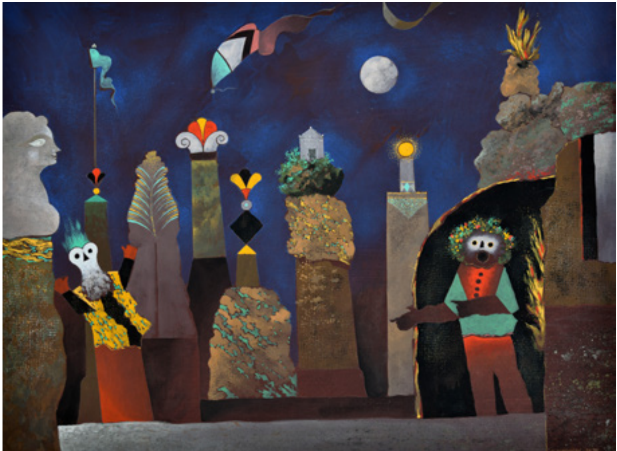
Vous ne craignez rien , peinture flashe sur papier arches, 74x55 cm, 2020

L'équilibriste bavard , peinture flashe sur papier arches, 37x 27 cm, Août 2023