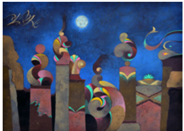
Grande parade , peinture flashe sur papier arches, 74x55 cm, 2021