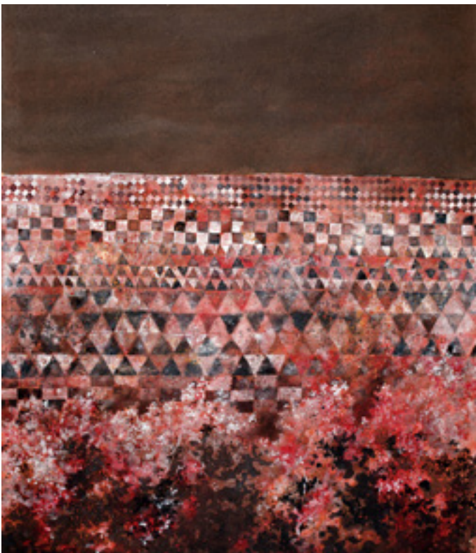
Muraille , acrylique sur papier, 65x50 cm, 1982

Ces jeux formels viennent aussi en opposition aux œuvres narratives dans ce va et vient constant que forme mon travail.