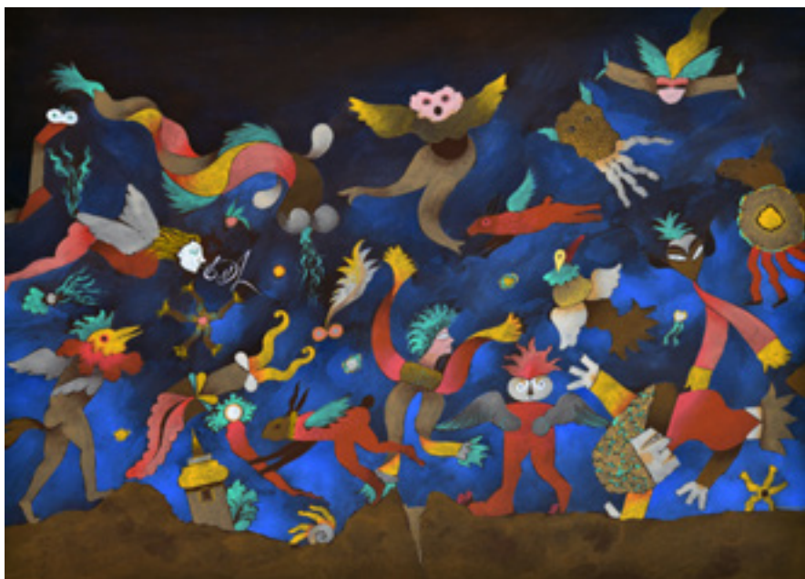
Hé que ça saute ! Peinture flashe sur papier arches, 74 cm x 54 cm, 2023

L'hybride est une porte ouverte pour l'évasion, tout en gardant des repères laissant aux regardeurs le soin de définir le sens qu'ils peuvent donner à « l'image ». Il s'agit de conserver le regard de celui qui passe d'une peinture à l'autre au rythme d'un tour opérateur.