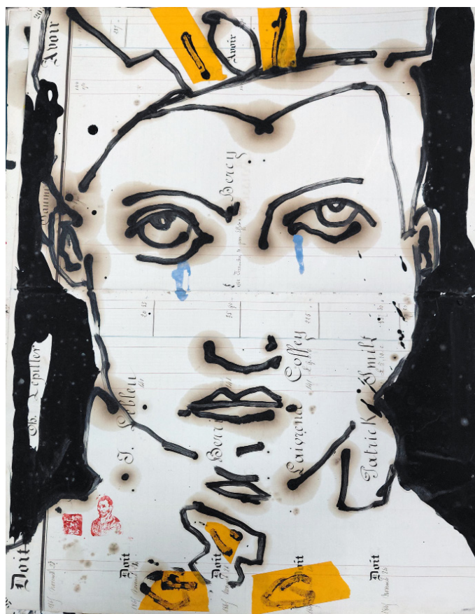
Edouard Manet, Léon, Technique mixte sur papier, 48,5x63,5 cm

Le trait y est encore une fois libre, sincère, la peinture lui sert d'encre dans ces journaux de bord. Chaque livre correspond à une tranche de vie de l'artiste, à des périodes qui résonnent dans le vécu collectif.