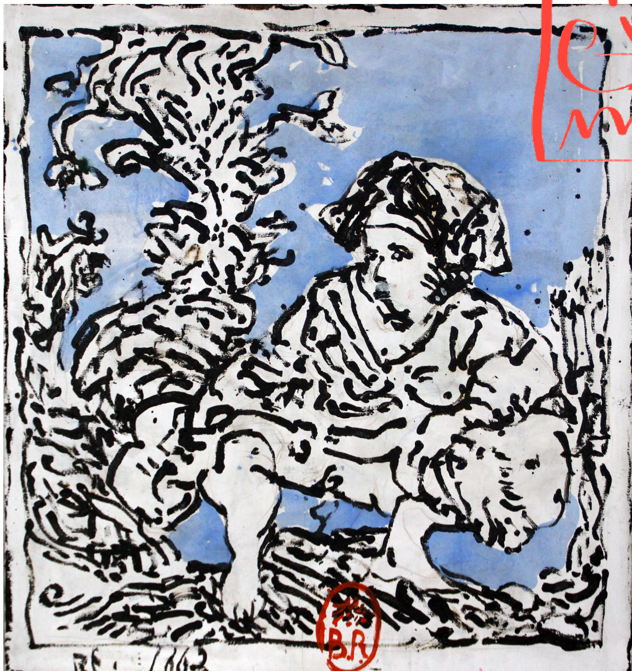
Rembrandt, Pisseuse (d'après gravure), Technique mixte sur toile, 137x147 cm