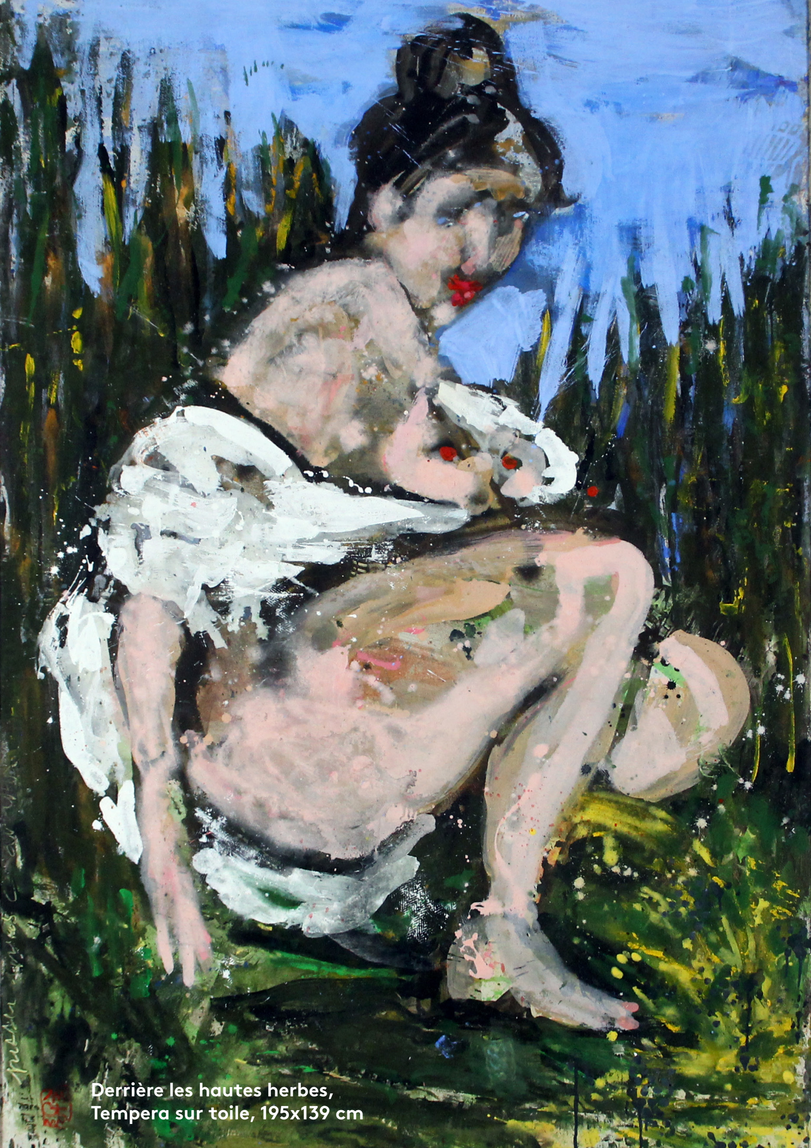
Derrière les hautes herbes, Tempera sur toile, 195x139 cm