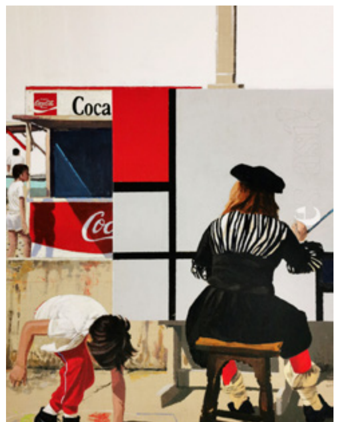
La realidad.. es así ! n° 1 acrylique sur toile, 1985, 116 x 89 cm

De la même façon, des chefs-d'œuvres sont réinterprétés, plantent un décor, dialoguent entre eux ou avec des éléments issus de la culture latino-américaine, des références à l'actualité ou à la culture populaire.