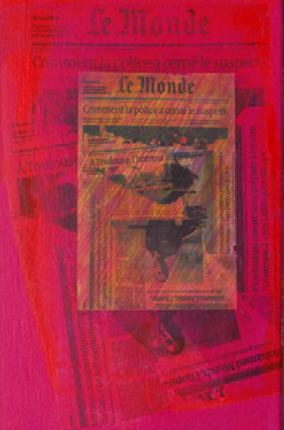
La chair du sectarisme acrylique sur bois, 2012, 80 x 60 cm