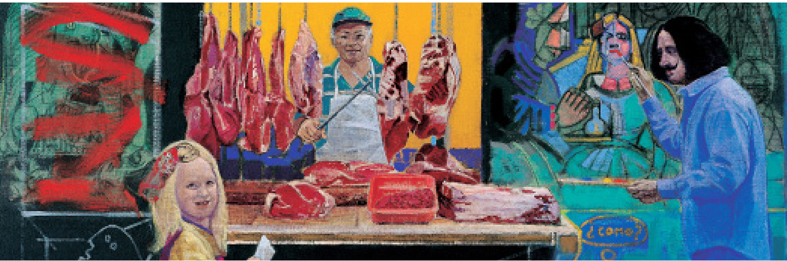
« Cómo? Don Diego decorando la carniceria a la manera de Don Pablo » (détail), acrylique sur toile, 2005, 146 x 146 cm

L'exposition au centre d'art FIAA rend hommage à Hermann Braun-Vega qui a su mettre sa grande maîtrise technique au service de la mémoire culturelle et des questions de société. Exposé dans de nombreuses grandes villes à travers le monde, Braun-Vega a aussi eu une exposition au Musée de Tissé du Mans à l'occasion de l'édition 2012 du festival Puls'Art. Herman Braun-Vega fait partie de ces artistes marquants de l'art de ces cinquante dernières années. Il restera en effet une des figures de la figuration narrative, mouvement pictural apparu dans les années 1960 en opposition à l'abstraction et certains mouvements de l'époque tels que le pop art. L'idée était de raconter une histoire à travers l'image, servant parfois de support à un message politique.