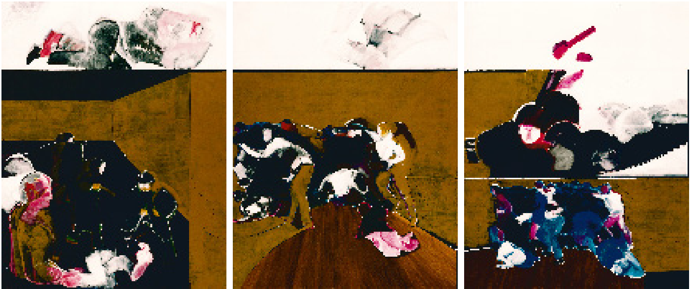
«Liberté? Egalité? Fraternité?» acrylique sur toile, mai 1968, triptyque 146 x 114 cm x 3

Des années 1950 aux années 1970, son travail reprend les codes de l'art moderne, avec des influences du cubisme ou de l'impressionnisme. Il adopte alors une gestuelle très libre, à mi chemin entre la figuration et l'abstraction.