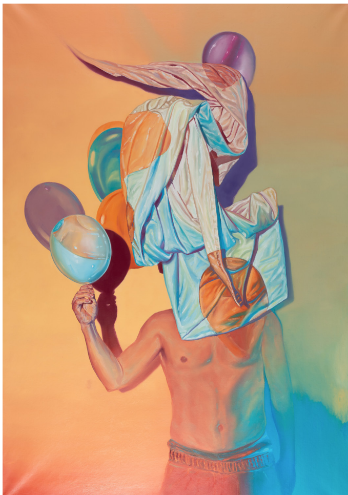
Ratur et Sckaro Full of emotions , huile sur toile, 2017, 195x130cm