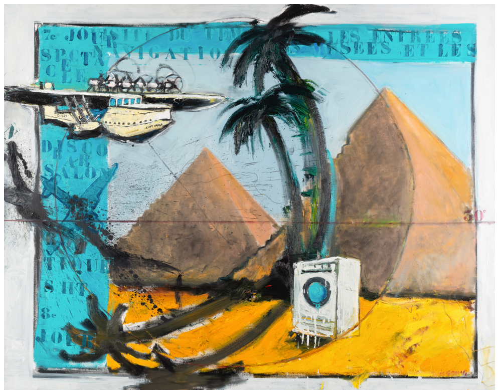
Bogdan Palovic Another day is going by , 1996, Huile sur bois, 116x162cm

Les chaises empilées sont un de ses sujets récurrents. Il capte la beauté de ces installations éphémères sur les terrasses des cafés ou dans des bureaux à l'ambiance austère. Outre l'aspect technique de l'hyperrealisme, l'idée est donc aussi de révéler l'intérêt plastique et esthétique d'objets du quotidien.