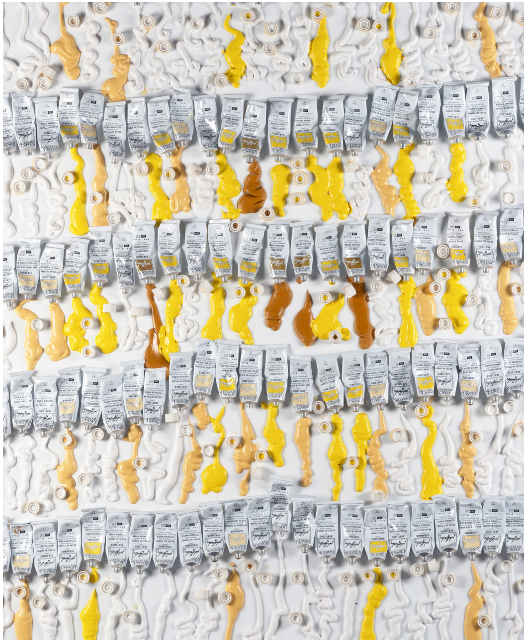
© Arman, Tubes de couleur, 1986, collage sur toile, Collection Lefranc Bourgeois

Centre d'art FIAA . Là Visitation . Le Mans Ouvert du mardi au dimanche de 14h à 18h