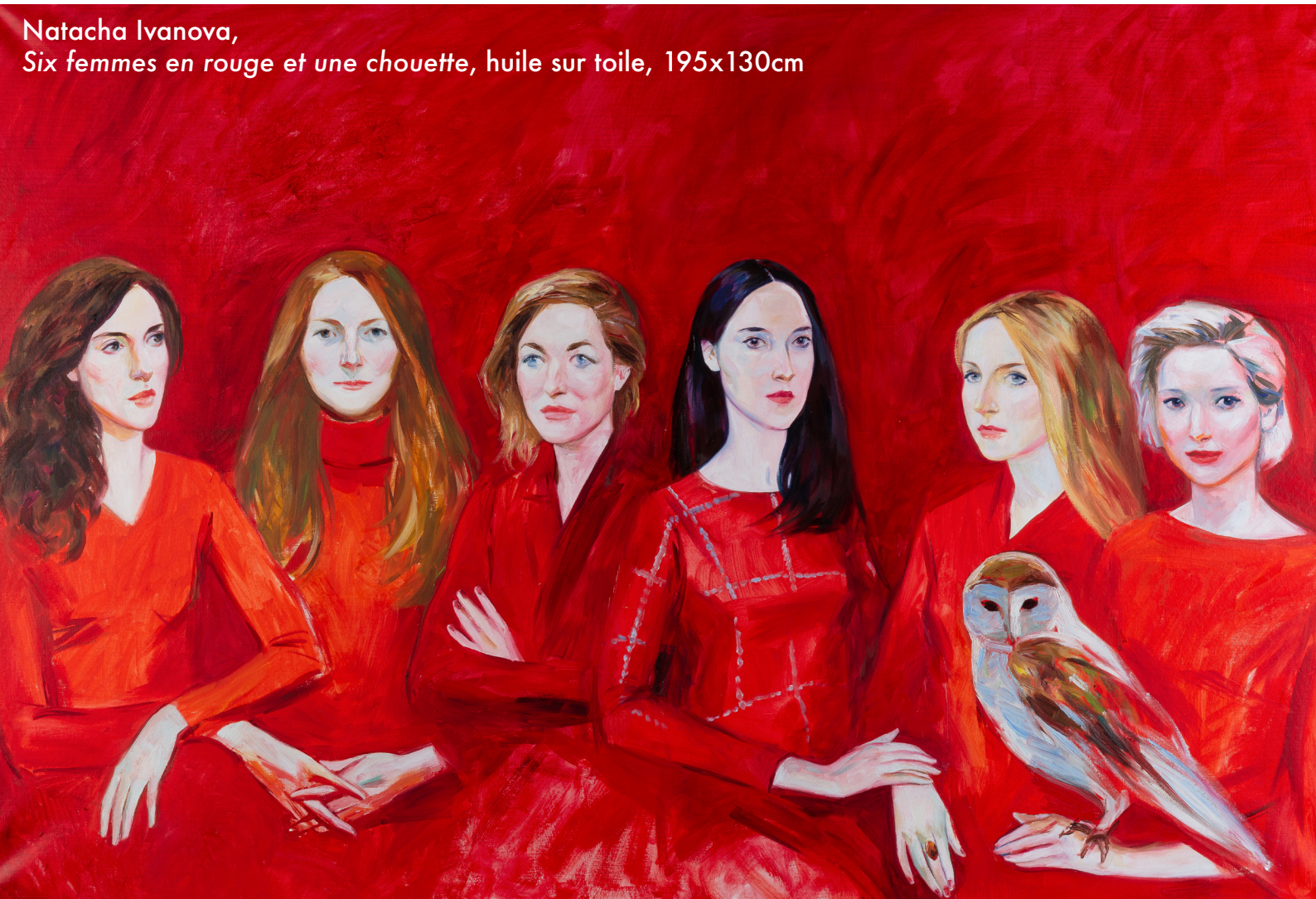
Natacha Ivanova, Six femmes en rouge et une chouette , huile sur toile, 195x130cm