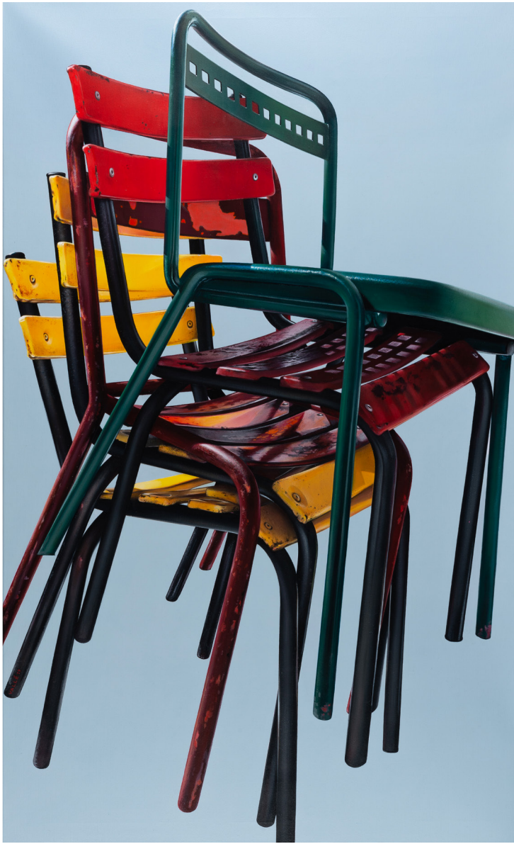
Didier Vallé Chez Cocotte 1 , Peinture flashe sur toile, 2019 89x146cm

Face aux toiles de Didier Vallé , le spectateur s'interroge à tous les coups sur la nature de l'œuvre qu'il a en face de lui : est-ce une photographie ou une peinture? Didier Vallé est en effet maître dans le style de l'hyperrealisme. En peinture, c'est un terme qui apparaît dans les années 1970 pour désigner ce courant artistique fortement influencé par le photoréalisme, qui vise à reproduire le plus fidèlement possible le contenu d'une photographie. C'est l'objet, la chose inanimée, qui est au centre des préoccupations plastiques de Didier Vallé.