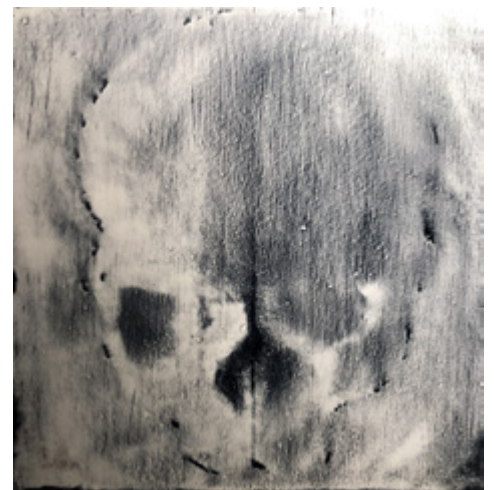
OLIVIER HEINRY , Triptyque, encre et peinture sur panneaux de bois, 3x85X85cm