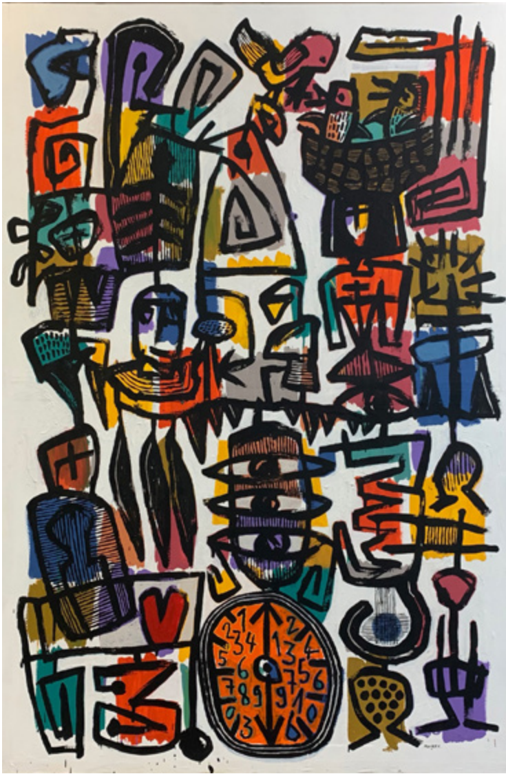
CHRISTIAN MOUREY N°2158 , peinture acrylique sur carton ondulé 8OP, 146x97, 2023