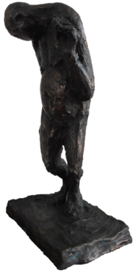
MILAN LUKAC Bronze, H30 cm, 1998