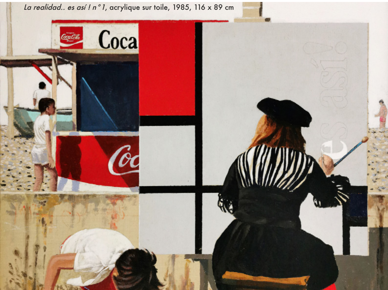
La realidad.. es así ! n°1 , acrylique sur toile, 1985, 116 x 89 cm

La peinture de Braun-Vega s'insurge contre les diktats de l'art officiel. Elle ouvre sur un univers imaginaire où l'on se risque, avec humour et ironie, à des émotions inattendues : indignation, exaltation, solidarité.