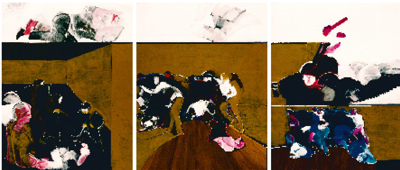
«Liberté? Egalité? Fraternité?» acrylique sur toile, mai 1968, triptyque ,146 x 114 cm x 3

Des années 1950 aux années 1970, son travail reprend les codes de l'art moderne, avec des influences du cubisme ou de l'impressionnisme. Il adopte alors une gestuelle très libre, à mi chemin entre la figuration et l'abstraction.